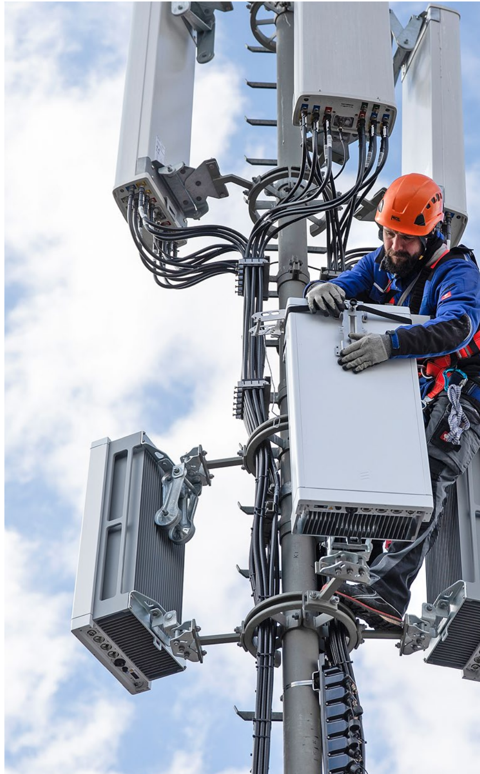
Montage eines 5G-Elements: Einhaltung des Grenzwerts ohne Gewähr

14 bis 30 Tage. Detaillierte Infos zum Vorgehen sowie Musterbriefe bietet der Verein Schutz vor Strahlung auf seiner Website www.schutz-vorstrahlung.ch . Der Verein bietet auch einen «Antennenalarm» an, damit man keine Ausschreibung in der Nachbarschaft verpasst. Man füllt ein Formular aus und gibt seine Adresse an. Der Verein informiert per Mail, sobald in der Nähe ein Baugesuch für eine Antenne veröffentlicht wird.